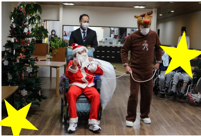
◇サンタ&トナカイでキャンドルサービス★