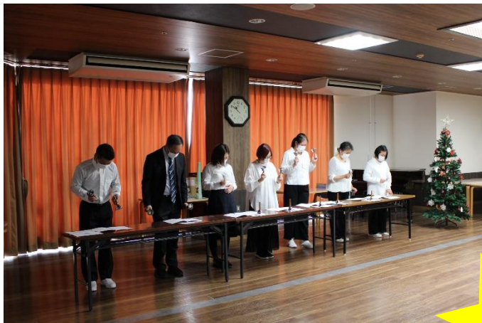
◆ハンドベル演奏会